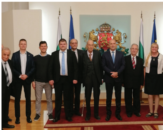
Членове на ръководството на САИ на церемонията по награждаването

Събитието се провежда за 22-ра поредна година във връзка с рождената дата на видния изобретател от български произход Джон Винсент Атанасов, професионален празник на специалистите по компютърна техника, информационни технологии и автоматика в България.